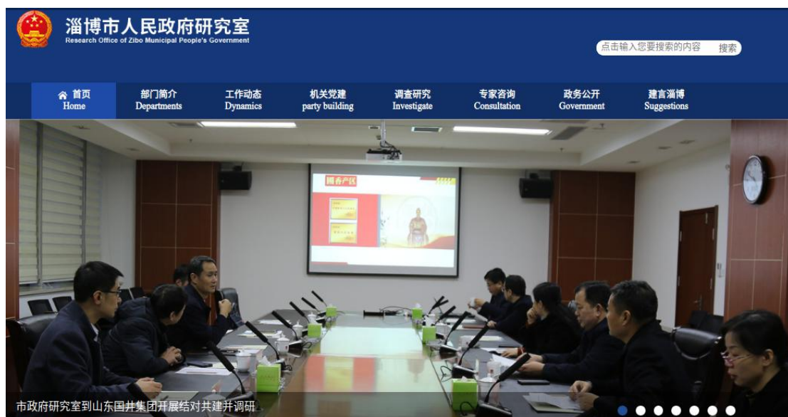
市政府研究室官网

策信息 3000 余条，企业关注人数突破 3 万人；“淄博惠企政策服务平台”发布政策申报指南 150 项，成为我市重要的政策信息公开发布平台。