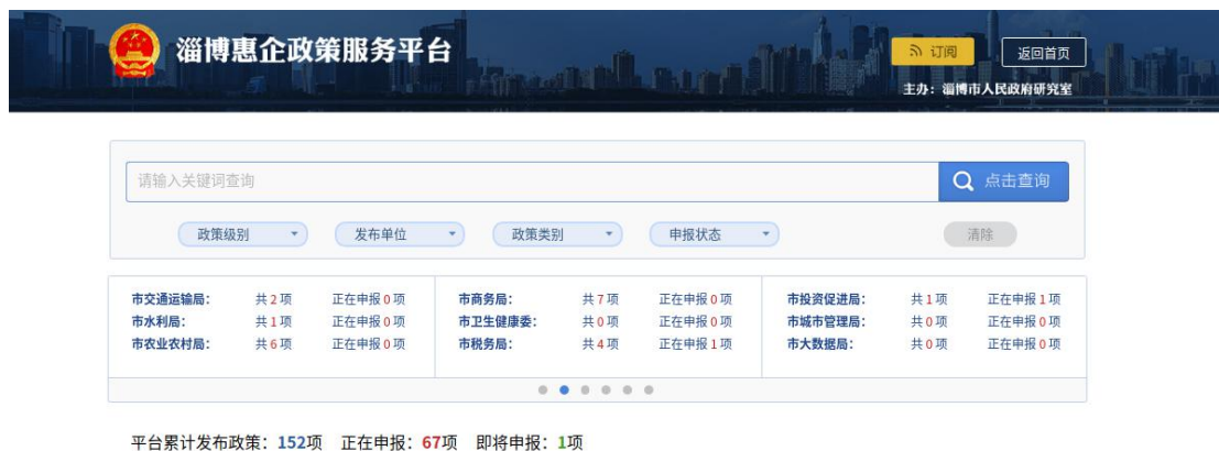
淄博惠企政策服务平台